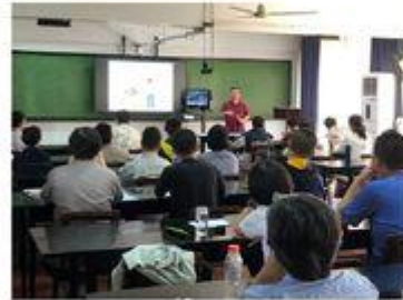
菲律賓馬尼拉研習工作坊