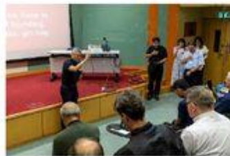
香港地區牧靈界線研習