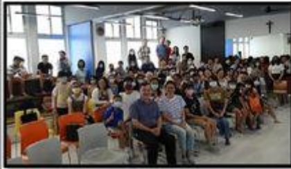
耕莘文教院兒少保護巡迴講座