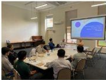
亞太耶穌會兒少保護防護網絡會議