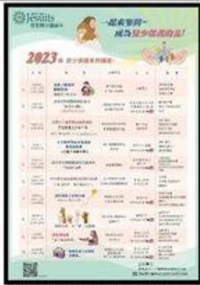
兒少保護巡迴海報