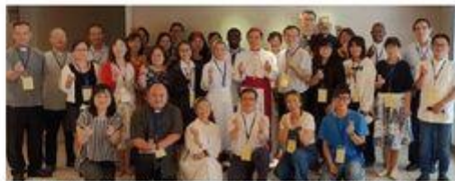
台灣地區主教團「兒少保護培訓課程」